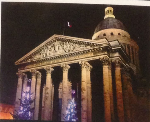
Depuis la salle, une extraordinaire vue sur le Panthéon.